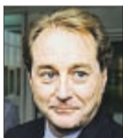
Kjell Inge Røkke.

DN oppnådde igår ikke kontakt med Aker RGI eller eieren Røkke.